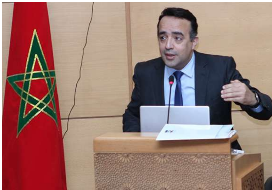
Hicham ZANATI SERGHINI, DG de la Caisse Centrale de Garantie

Intelak » cible les auto-entrepreneurs, les jeunes diplômés, les Micro et Très petites entreprises, le secteur informel et les petites entreprises exportatrices vers l'Afrique. Avec une quotité de garantie s'élevant à 80% des crédits inférieurs à 1,2 millions de dirhams, cet instrument bénéficie essentiellement aux entreprises en phase de création ou créées depuis moins de 5 ans. Notons que cette phase représente un risque accru pour toute entreprise. Notant cependant que cette limitation ne s'applique pas aux entreprises exportatrices vers l'Afrique.