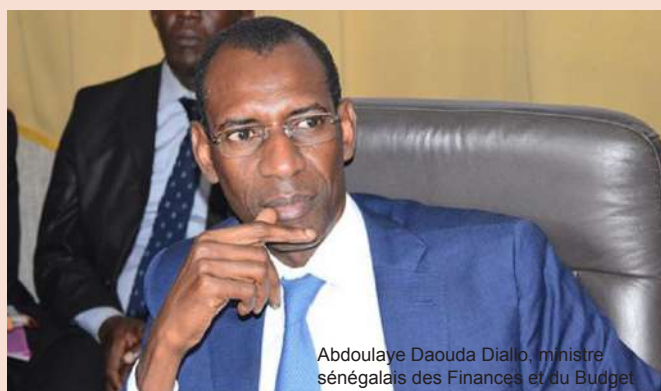
Abdoulaye Daouda Diallo, ministre sénégalais des Finances et du Budget

L e ministre sénégalais des Finances et du Budget, Abdoulaye Daouda Diallo, a mis en exergue, mardi 21 janvier la « bonne santé économique et financière » de son pays au terme de la gestion 2019.