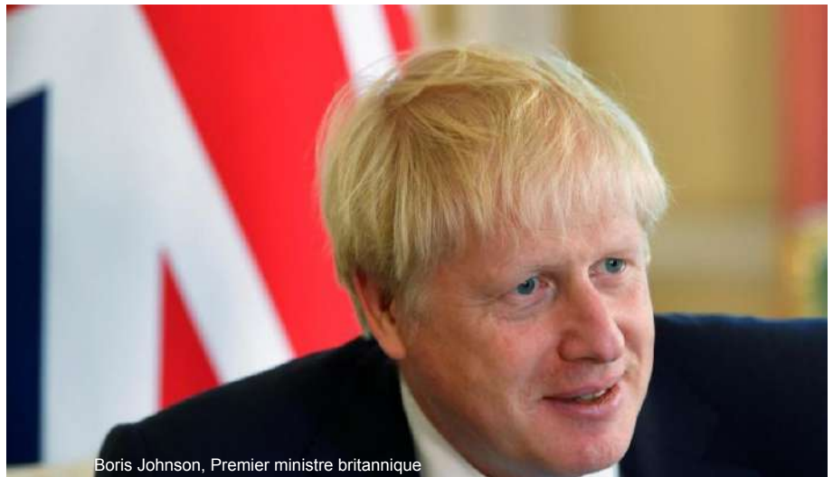
Boris Johnson, Premier ministre britannique

Le gouvernement du Premier ministre Boris Johnson a annoncé dimanche 26 janvier un plan pour faciliter et accélérer l'entrée au Royaume-Uni des meilleurs chercheurs et scientifiques après le Brexit.