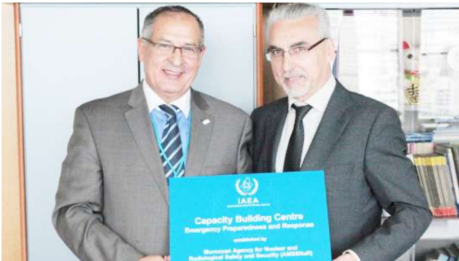
désignation d'AMSSNuR comme premier Centre Régional de l'AIEA en Afrique pour le développement des compétences en préparation et intervention en situation d'urgence nucléaire ou radiologique

L'Agence Marocaine de Sûreté et de Sécurité Nucléaires et Radiologiques (AMSSNuR) vient de publier son bilan et ses perspectives concernant son plan stratégique 2017/2021.